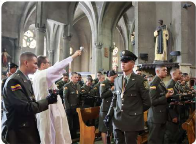
Bendición de las placas del curso 008 de Patrulleros de la Escuela de Carabineros Alejandro Gutiérrez, en Manizales