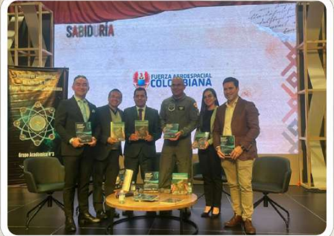
Presentación del libro "Revolución educativa: la inteligencia artificial en las escuelas de formación en Colombia"