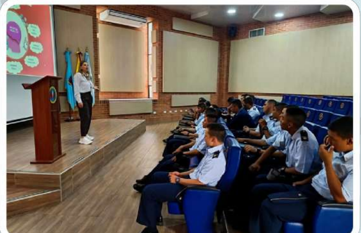
Visita a la Comisión a la Escuela Militar de Aviación "Marco Fidel Suárez" en Cali