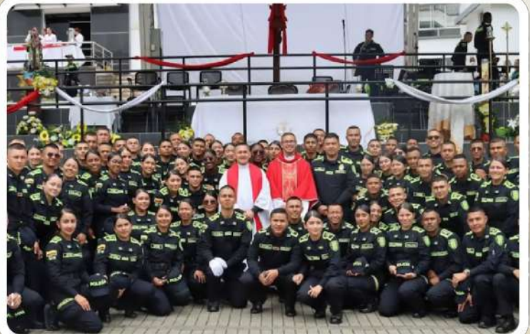
93 estudiantes del programa de patrullero de policía, de la escuela Alejandro Gutiérrez en Manizales, recibieron el sacramento de la confirmación.