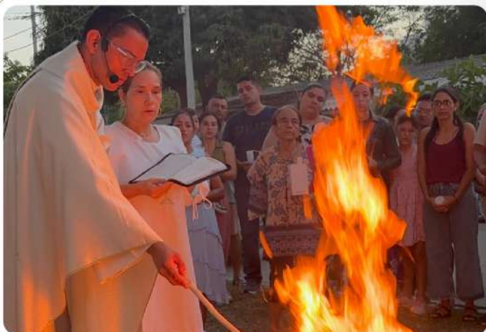
Solemne Vigilia Pascual en la Capilla Nuestra Señora del Carmen, en Cartagena