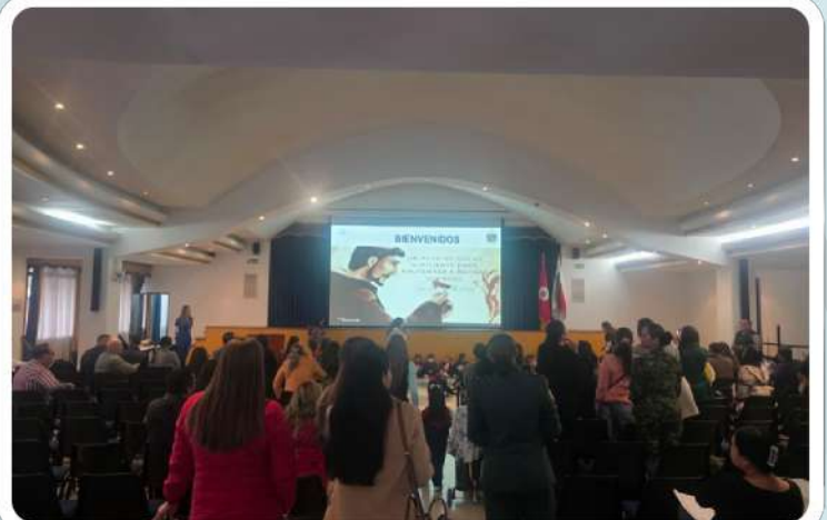
En el marco del Año de San Francisco de Asís se continúa llevando el mensaje evangelizador a las familias del Liceo Bachillerato Patria