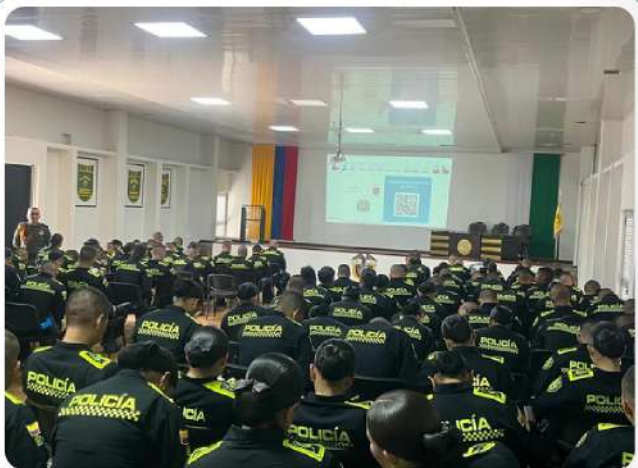
Seminario de Formación Integral en Derechos Humanos, dirigido al personal de la Escuela de Carabineros Alejandro Gutiérrez