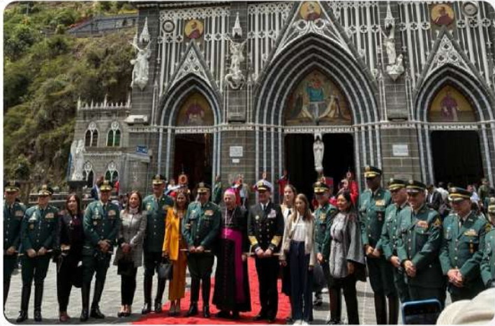
Consagración del Arma de Caballería a Nuestra Señora del Rosario de Las Lajas