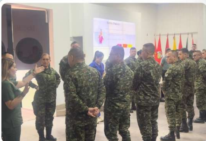
Visita a la Novena Brigada del Ejército Nacional, en la ciudad de Neiva (Huila).