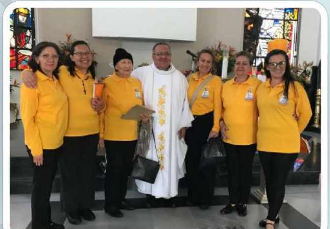
Retiro espiritual del "Pueblo de Dios" en el Centro Religioso de la Policía Nacional