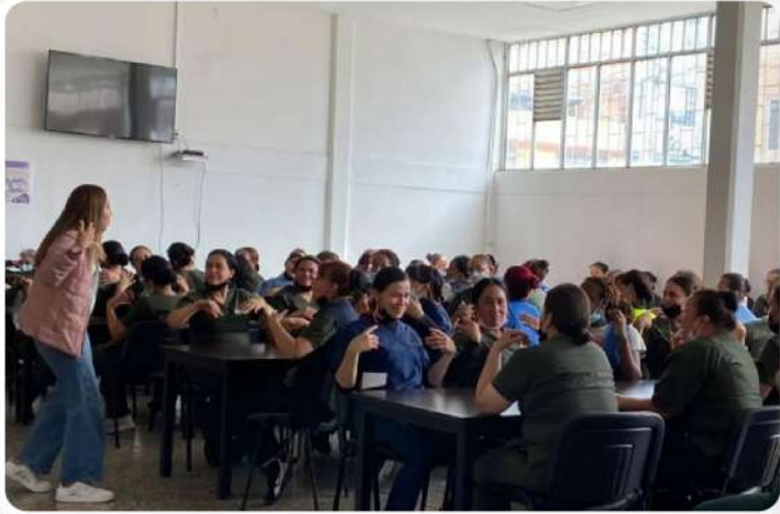
Jornada de Fortalecimiento Espiritual y Bienestar Integral en las instalaciones del Fondo Rotatorio de la Policía